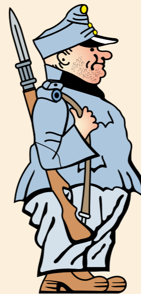
Soldat Schwejfk ... zur böhmischen Küche mit Knödeln und Kaiserschmarren